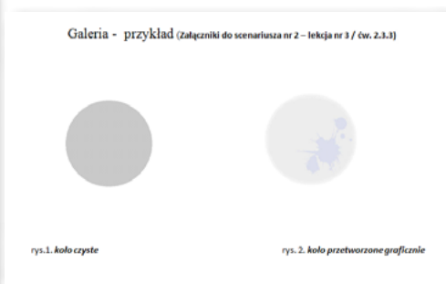
Rys. Praca w edytorze Word

Efekt widoczny w prezentacji Prezi po wstawieniu pliku PDF